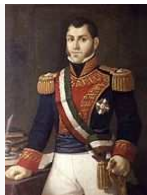
Guadalupe Victoria , Primer Presidente de México.

Durante la consumación de la Independencia de México , parte de la organización territorial de la Nueva España pasaría íntegra a la nueva nación del Imperio Mexicano por el Congreso Constitucional, mediante la división en intendencias y provincias, además del anexo íntegro y total de la Capitanía General de Yucatán y la Capitanía General de Guatemala con el fin de unirse políticamente, como una estrategia para contrarrestar a la corona española, logrando así la mayor extensión territorial de México como nación independiente.