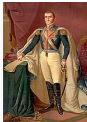
Agustín de Iturbide , Primer Emperador de México.

Durante la consumación de la Independencia de México , parte de la organización territorial de la Nueva España pasaría íntegra a la nueva nación del Imperio Mexicano por el Congreso Constitucional, mediante la división en intendencias y provincias, además del anexo íntegro y total de la Capitanía General de Yucatán y la Capitanía General de Guatemala con el fin de unirse políticamente, como una estrategia para contrarrestar a la corona española, logrando así la mayor extensión territorial de México como nación independiente.