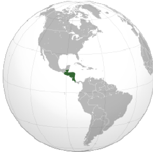
Mapa de la Federación