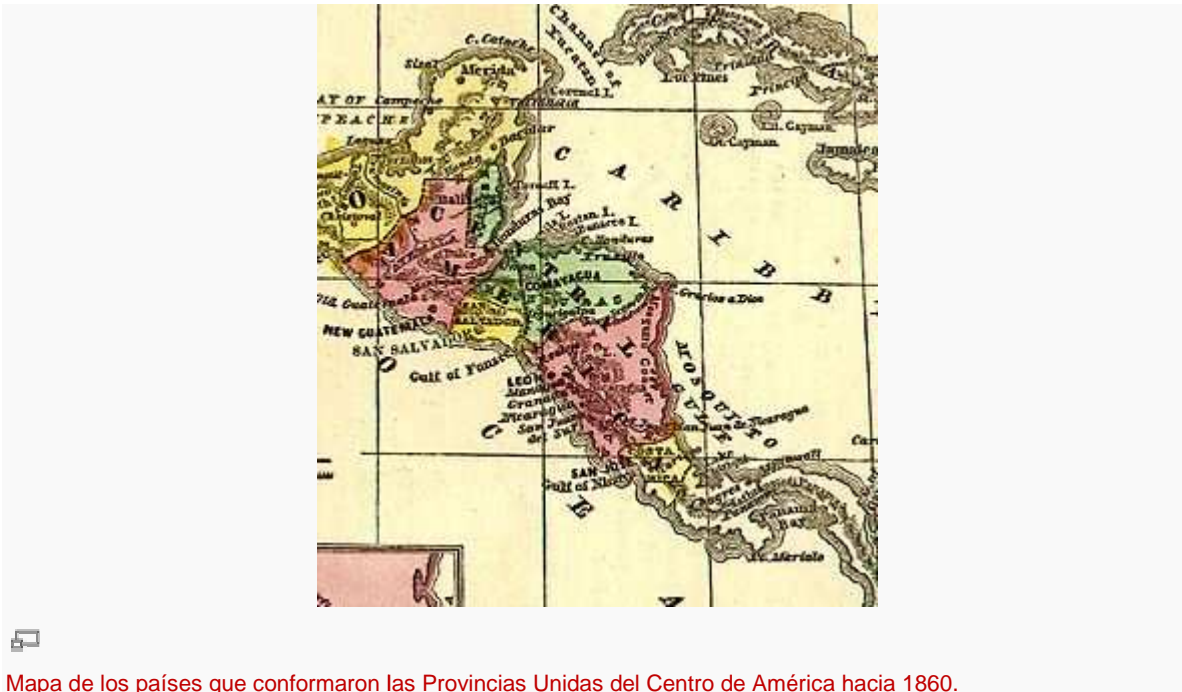
Mapa de los países que conformaron las Provincias Unidas del Centro de América hacia 1860.

Para la organización definitiva del país, la Asamblea Constituyente nombró una comisión para redactar un proyecto de Constitución. Esta comisión, formada por cuatro diputados de ideología liberal, trabajó primero en un documento denominado Bases de Constitución Federal, en el que se recogían los principios fundamentales de la futura Carta fundamental y se delineaba la organización del gobierno.