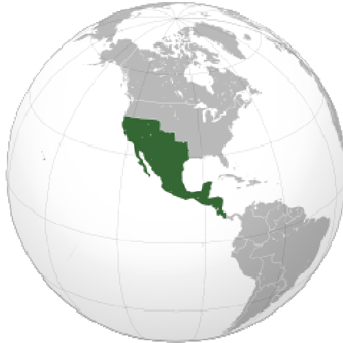
Extensión del imperio en 1821